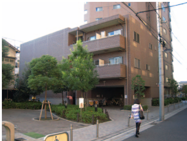
都心共同住宅供給事業*による良質な住宅の供給と住環境の改善