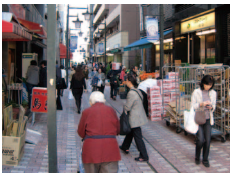
地域に密着した商店街 (小石川すずらん通り商店街)