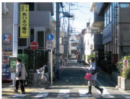
安全な通学路とするために名付けられた通り (汐見小・八中あいさつ通り)