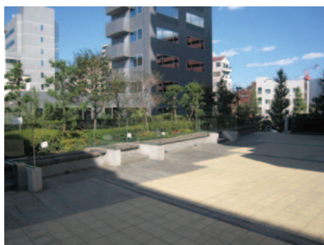
市街地再開発事業*によるオープンスペースの創出 (小石川柳町地区)