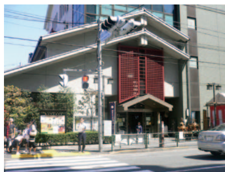
地域住民の交流の場（不忍通りふれあい館）